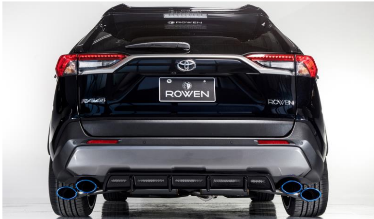
※Vertical Dual Type

製造/販売元 株式会社 E・Rコーポレーション ROWEN事業部 愛知県豊田市堤本町山畑7 TEL:0565-52-8555