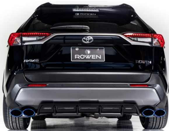
※Parallel Dual Type